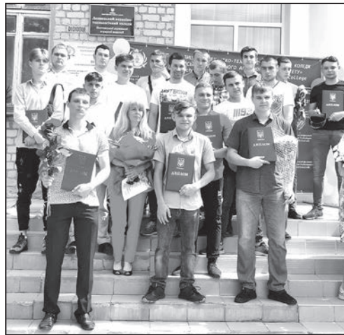
ціаліста харчової галузі стане стартом до нових висот.